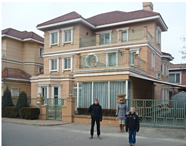
(Náš nový čínský domov)

Jezera byla vzhledem k mrazivému počasí zamrzlá a nabízeli zde atrakci, že se na jezeře mohlo bruslit různým způsobem. Buď půjčovali klasické brusle, nebo se mohlo jezdit na upravených kolech nebo se mohlo sedět na sedátku a odstrkovat se kovovými hůlkami. My jsme si půjčili lední kola a vyblbli jsme se na nich. Jak jsem již napsala, Číňané jsou velmi hraví a dokážou vymyslet všelijakou zábavu, protože jejich vláda jim toho tady moc neumožňuje.